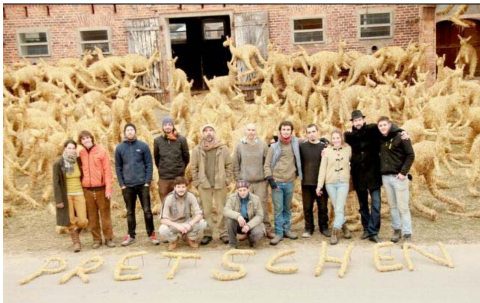
Članovi Slame s kolegama iz Mađarske i domaćinima ispred 200 klokana u njemačkom selu Pretschen