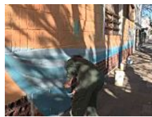
Buenos Aires: Mit Street Art gegen Vandalismus