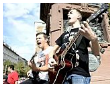
Stuttgarter singen gegen Fremdenhass